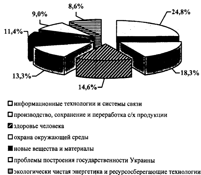
Рис. 3. Структура научных исследований и разработок, выполненных в 2001 г.

Продолжаются исследования по приоритетным направлениям. Их структура в 2001 году приведена на рис. 3. Приоритетные позиции занимают информационные технологии и системы связи (24,8%), за ними следуют сохранение и переработка сельскохозяйственной продукции (18,3), здоровье человека (14,6%), охрана окружающей среды (13,3%) и т.д.