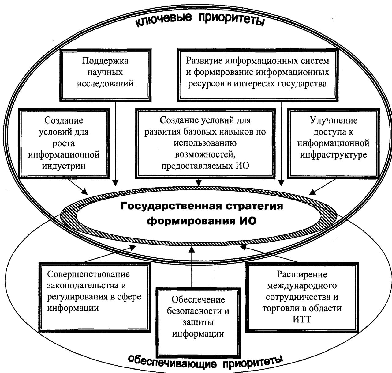
Рис. 2. Приоритеты государственной стратегии формирования информационного общества

- для разработки эффективной общегосударственной стратегии формирования и развития информационного общества Украине целесообразно основывать свою политику в этом направлении на предложенных приоритетах (рис. 2).